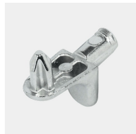
Supports d'étagères résistants à l'arrachement