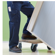
corps solidement chevillé et collé en usine