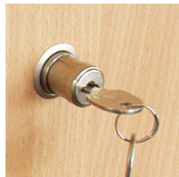
Portes coulissantes verrouillables