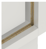
résistance à la déformation grâce à un panneau arrière de 8 mm d'épaisseur