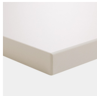
matériau du plateau en mélaminé avec chants robustes en plastique