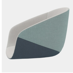
Qualité durable grâce à une fabrication de haute qualité