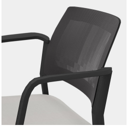
Dossier ergonomique en maille filet respirante