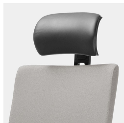
Réglage de la hauteur par ressort à gaz de sécurité