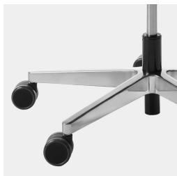
Réglage de la hauteur par ressort à gaz de sécurité