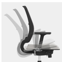
Cadre robuste en porte-à-faux