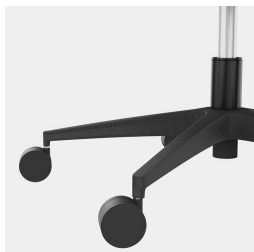
Réglage de la hauteur par ressort à gaz de sécurité