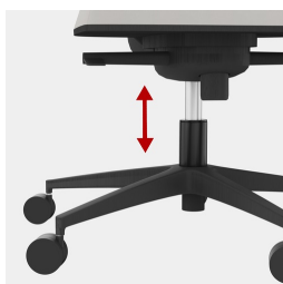
Cadre robuste en porte-à-faux