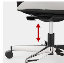
Cadre robuste en porte-à-faux