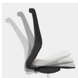
Cadre robuste en porte-à-faux