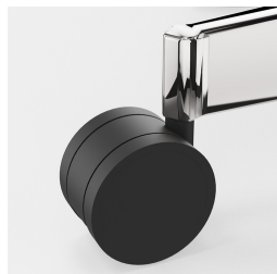
Réglage de la hauteur par ressort à gaz de sécurité