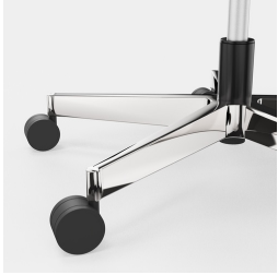
Réglage de la hauteur par ressort à gaz de sécurité