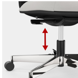
Cadre robuste en porte-à-faux