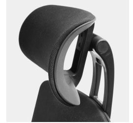
Réglage de la hauteur par ressort à gaz de sécurité