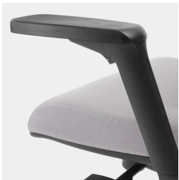
Réglage de la hauteur par ressort à gaz de sécurité