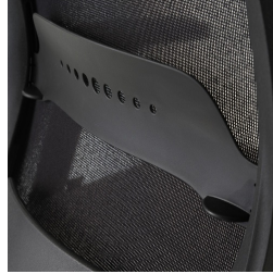
Dossier résille noir, avec réglage du soutien lombaire