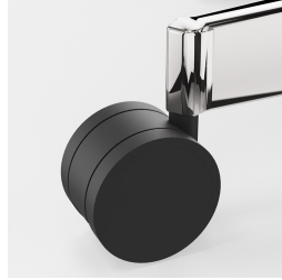
Réglage de la hauteur par ressort à gaz de sécurité