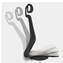
Cadre robuste en porte-à-faux