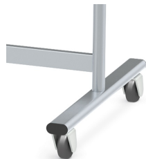
Table mobile sur 4 roulettes pivotantes robustes, dont 2 verrouillables

La surface d'écriture peut être tournée à 360° / peut être verrouillée dans n'importe quelle position.