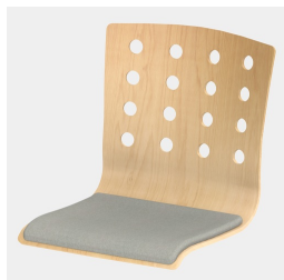
En option, avec coussin de siège