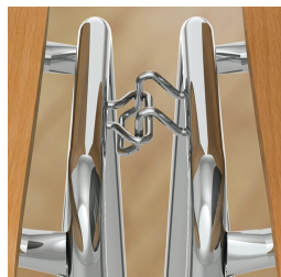
Cadre avec connexion de rangée