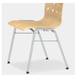
Cadre robuste à 4 pieds