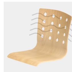
La coque du siège avec des découpes rondes assure une circulation d'air optimale.