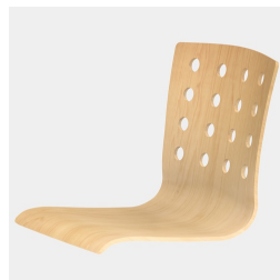
Coque de siège façonnée pour s'adapter au corps