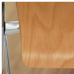
Coque de siège laquée de manière écologique avec une laque à base d'eau