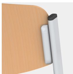
Assise et dossier vissés de manière invisible