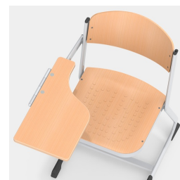
Base de traîneau robuste et solide en forme de C avec surface d'écriture