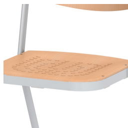
Surface d'assise avec boutons antidérapants enfoncés dans le sol