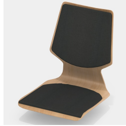
En option, avec coussin plat pour l'assise et le dossier