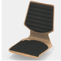
En option, avec un rembourrage de l'assise et du dossier en forme de vague.