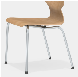
Cadre robuste à 4 pieds