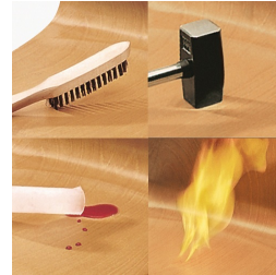
Coque indestructible en PAGHOLZ®, résistante aux rayures, aux chocs et aux flammes.