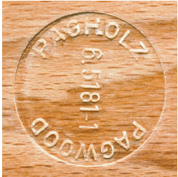
PAGHOLZ® issu de la sylviculture durable