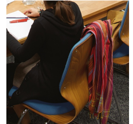
Le dossier particulièrement haut augmente le confort d'assise