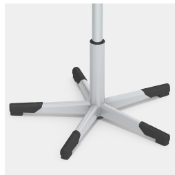
Base en acier absolument robuste