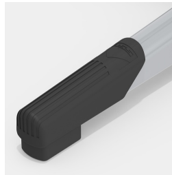
Protections de sol en plastique robuste avec protection des marches