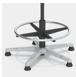
Base robuste en aluminium avec élévation et anneau de pied chromé, réglable en hauteur