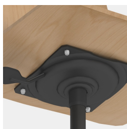
Réglage de la hauteur par ressort à gaz de sécurité