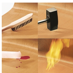
Coque indestructible en PAGHOLZ®, résistante aux rayures, aux chocs et aux flammes.