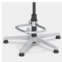
En option, avec un anneau de pied partiel