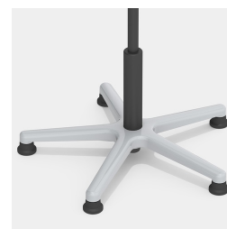
Base en aluminium absolument robuste