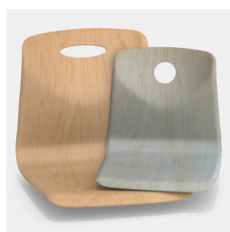
En option, avec trou de préhension, rond ou ovale (pas avec coussin de dossier)