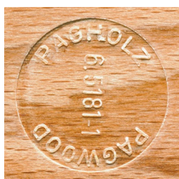
PAGHOLZ® issu de la sylviculture durable