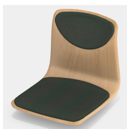
En option avec rembourrage de l'assise et du dossier (uniquement tailles 6E, 7)