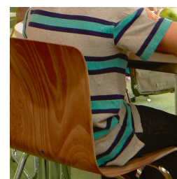
Forme de coque ergonomique et flexible