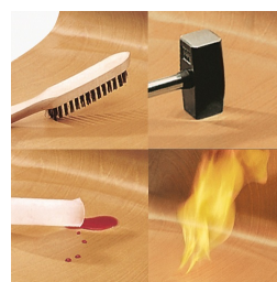
Coque indestructible en PAGHOLZ®, résistante aux rayures, aux chocs et aux flammes.