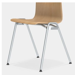
Cadre robuste à 4 pieds