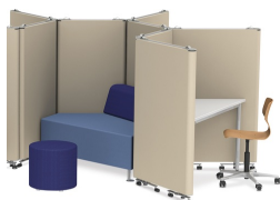
Zonage flexible de la pièce