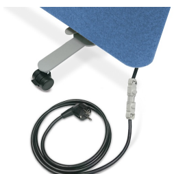
En option, avec un ensemble électrique