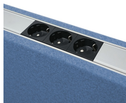
Ensemble électrique en option avec prise de courant à 3 voies avec mise à la terre