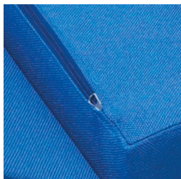
Couverture amovible avec fermeture éclair