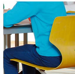
Forme de la coque adaptée à l'ergonomie et à l'orthopédie