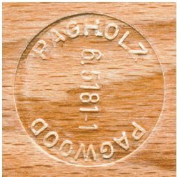
PAGHOLZ® issu de la sylviculture durable