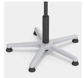
Base en aluminium absolument robuste