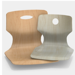
En option, avec un trou de préhension, rond ou ovale.