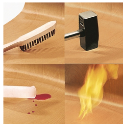
Coque indestructible en PAGHOLZ®, résistante aux rayures, aux chocs et aux flammes.