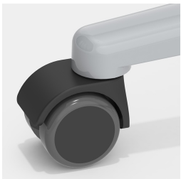
En option, avec des roulettes freinées en fonction de la charge.