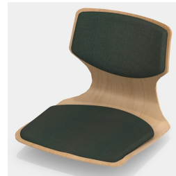
En option avec rembourrage de l'assise et du dossier (uniquement tailles 6E, 7)