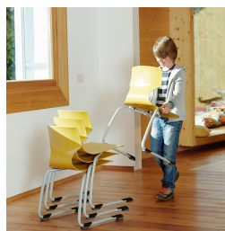
Empilable jusqu'à 5 chaises (sans rembourrage)