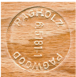
PAGHOLZ® issu de la sylviculture durable