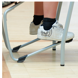
Cadre robuste en forme de C avec protections de sol A2S FLOORSAFE®.