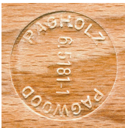
PAGHOLZ® issu de la sylviculture durable