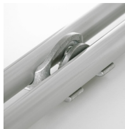
En option, avec dispositif d'accouplement à partir de la taille 5