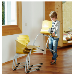
Empilable jusqu'à 5 chaises (sans rembourrage)