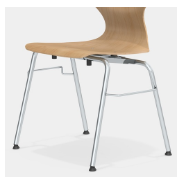
Cadre robuste à 4 pieds