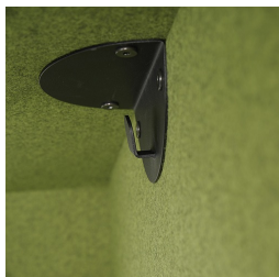
Avec deux porte-manteaux, à gauche et à droite