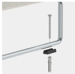
Optional mit geschraubter oder geklebter Bodenbefestigung