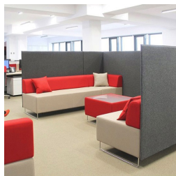
Extensible individuellement grâce à des éléments interconnectés