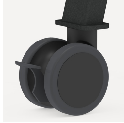
Vier große Doppelaufrollen jeweils mit Feststellbremse