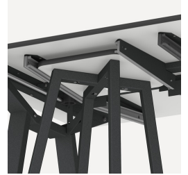
Halterung für FLEXLAB Hocker und Tidy Boxen