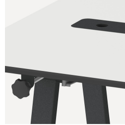
Multifunktional durch verschiedene Ausstattungsmöglichkeiten