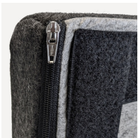
Abnehmbarer und waschbarer Bezugsstoff