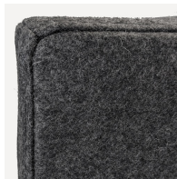
Saubere Befestigung mit stabiler Montageplatte, geschraubt