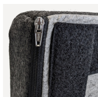
Abnehmbarer und waschbarer Bezugsstoff