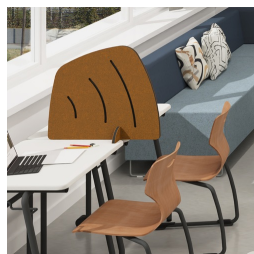
Als Sichtschutz auf Schultischen

Unser Material- und Farbsortiment finden Sie in der ASS Materialübersicht.