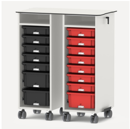
Zusätzliche Arbeitsfläche durch Aufsatzplatte