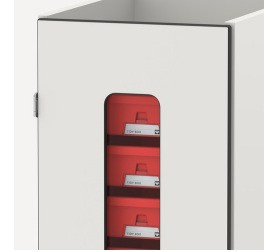
Die verglaste Front gibt freie Sicht auf die Materialien