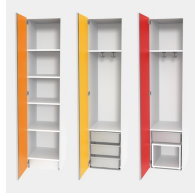
In 3 unterschiedlichen Ausstattungsvarianten