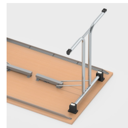
Einfaches Einklappen der Tischbeine