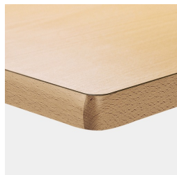
Optional Tischplatte melaminharzbeschichtet mit Massivholzkante