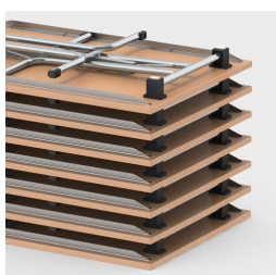
Bis zu 16 Tische stapelbar