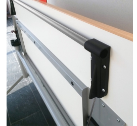
Auslösen der Klappfunktion mittels 2-Hand- Sicherheitsbedienung