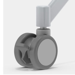
Inklusive 4 robusten Doppellenkrollen mit Totalfeststellung