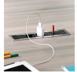
Optional je zwei Steckdosen mit USB Port oder Netzwerkanschluss: links und rechts