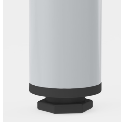
Bodenschoner mit Niveaueausgleich: gleicht Bodenebenheiten aus