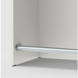
Inklusive Fußstütze zum bequemem Ablegen der Füße