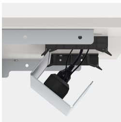
Verdecktes Kabelmanagement durch klappbare Kabelwanne