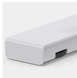
Bodenschoner mit Niveauegleich zum einfachen Ausgleichen von Bodennebenheiten