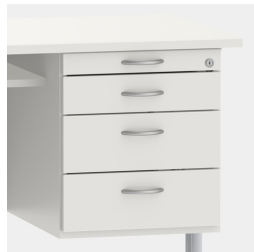
Unterschrank inkl. Utensilienauszug und Schubladen mit Einzugsdämpfung und Zentralverschluss