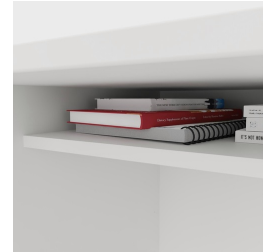
Inklusive praktischer Ablage