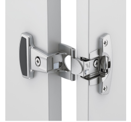
Metall-Topfscharnierbänder mit 240° Öffnungswinkel