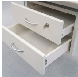
Inklusive abschließbarem Schulbadenunterschrank