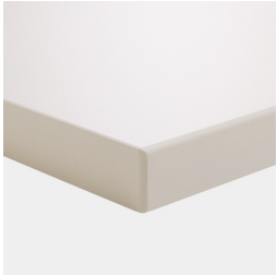
Tischplatte melaminharzbeschichtet mit robuster Kunststoffkante