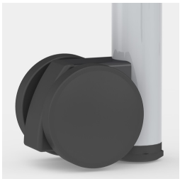
Optional Gestell fahrbar mittels 2 Rollen