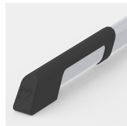
Bodenschoner mit integriertem Trittschutz