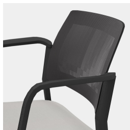
Ergonomisch geformte, atmungsaktive NetZRückenlehne