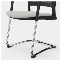
Robustes Freischwinger- Gestell