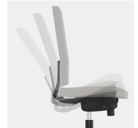
Synchronmechanik: Federkraft bzw. Widerstand an Körpergewicht anpassbar