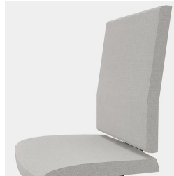
Ergonomisch geformte Rückenlehne