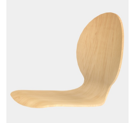
Körpergerecht geformte Sitzschale