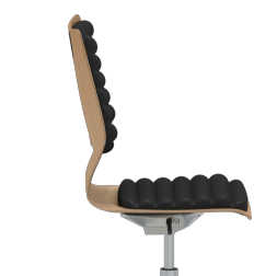
Sitzneigemechanik aus massivem Aluminium