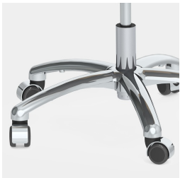
Absolut robustes Alu-Fußkreuz