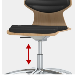
Höhenverstellung durch Sicherheitsgasfeder