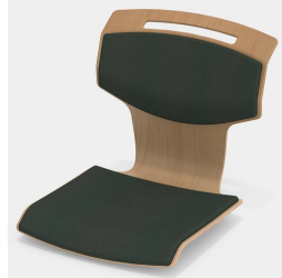
Optional mit Sitz- und Rückenpolster