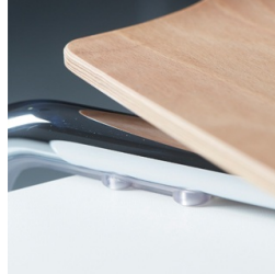
Platten- und Kantenschoner schützen den Tisch beim Aufstuhlen