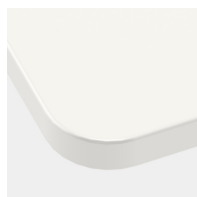
En option, plateau de table avec rayon d'angle de 40 mm