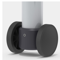
En option, châssis mobile grâce à 2 roulettes fixes