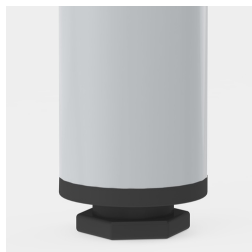
la protection de sol avec compensation de niveau compense les inégalités du sol